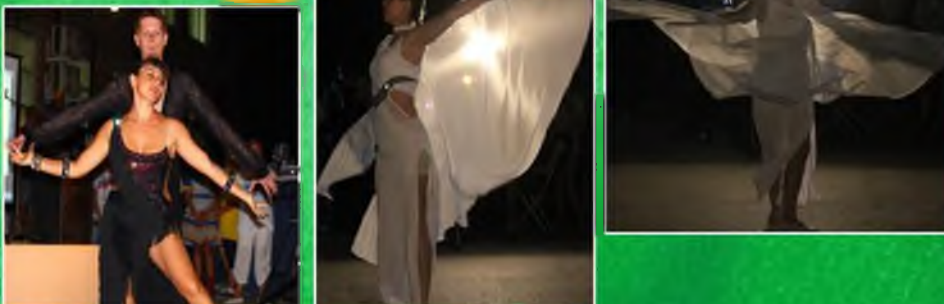
Автор: Ксения Водопьянова

В этом году всё изменилось. В качестве артистов были... педагоги и вожатые! По словам Евгении, концерт был отличным, и ей понравилось, что в концерте участвуют как дети, так и взрослые. Позже оказалось, что все ребята были довольны концертом, ведь он удался на славу!